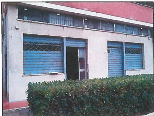
Via Costanza n. 12/14

sup.netta tot. mq. 66,90 cat.catastale C/1 cod.fondo 00090710_5001