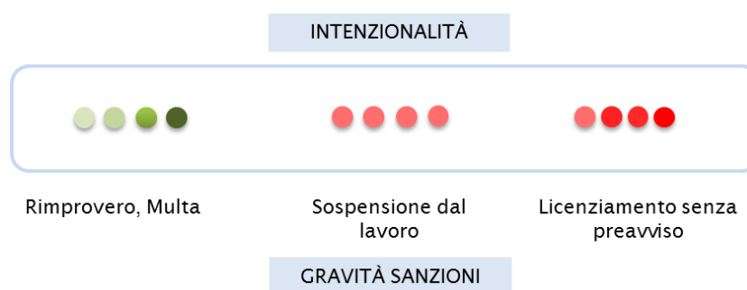
Fig. 8 - il sistema sanzionatorio

Esso deve essere ispirato alla gradualità della sanzione, procedendo dall'errore all'intenzionalità (Fig. 8).