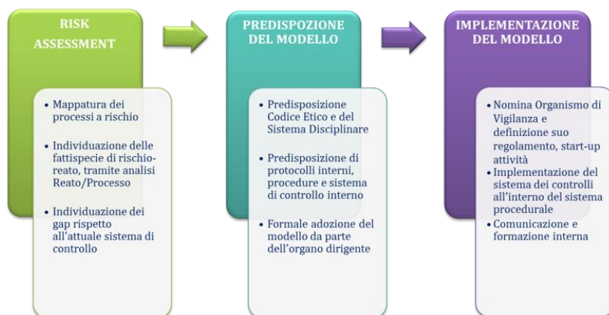
Fig. 3 - Fasi di costruzione del Modello 231