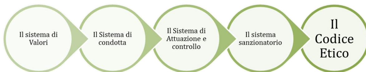
Fig. 7 - La struttura del Codice Etico

Il Codice Etico, proposto in questa linea guida, è composto da 4 sezioni, ciascuno delle quali rappresenta un elemento del complessivo sistema Etico delle società di E.R.P. (Fig. 7).