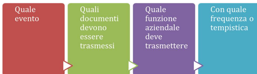
Fig. 9- Il flusso delle informazioni verso l'OdV

Al fine di strutturare idonei flussi di comunicazione verso l'Organismo, può essere utile strutturare nel protocollo apposito del Modello, una tabella che contenga le seguenti informazioni (fig. 9):