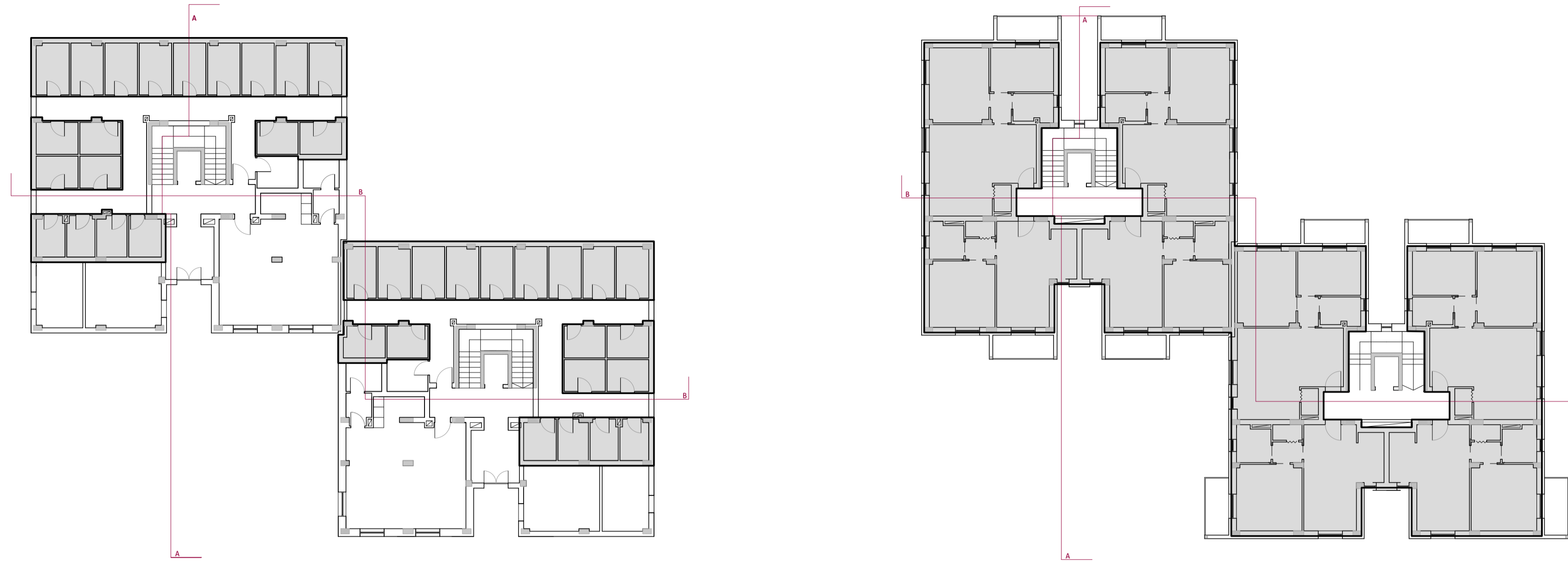
Pianta piano terra e piano tipo/scala 1:200 Schemi per calcolo volume